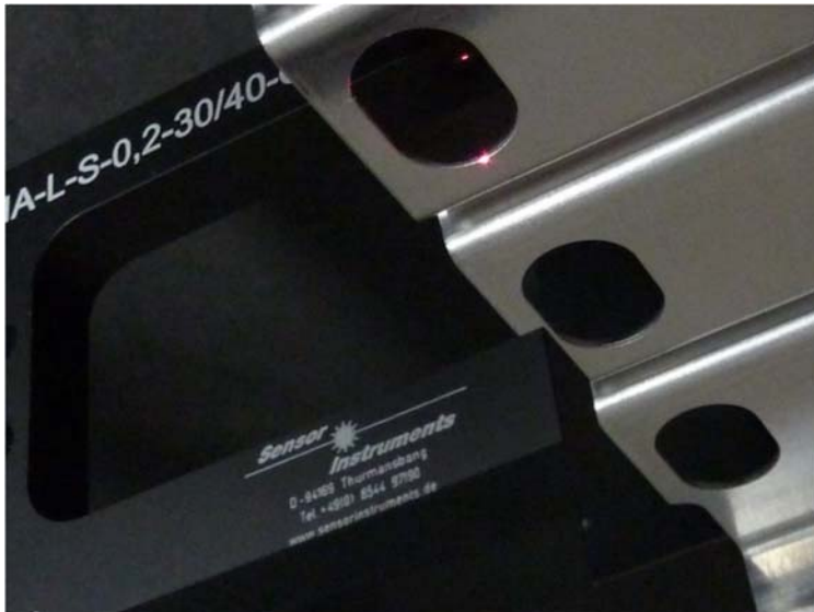
Posicionamiento preciso de la pieza troquelada mediante barrera fotoeléctrica de horquilla FIA-L-RL